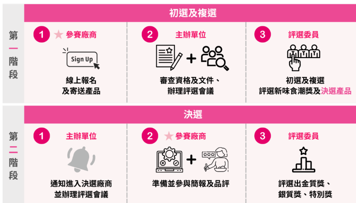
圖一、新味食潮評選流程