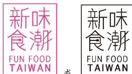
圖：新味食潮圖像與標準字

獲選產品得使用新味食潮圖像及標準字(見下圖或主辦單位同意之其他圖像或標準字)，該標誌不得用於表彰企業或該企業未獲選產品。